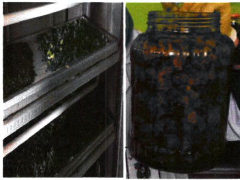
Gambar 1. Pembuatan simplisia