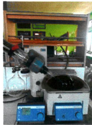
Gambar 2. Proses Maserasi

Maserat dipisahkan dengan cara filtrasi (penyaringan). Daun ketepeng cina kemudian masukkan ke dalam rotary evaporator dengan temperature 60°C selama \pm 1 jam sampai diperoleh ekstrak kentalnya. Setelah itu, didiamkan selama 2 jam sehingga ekstraknya kering.