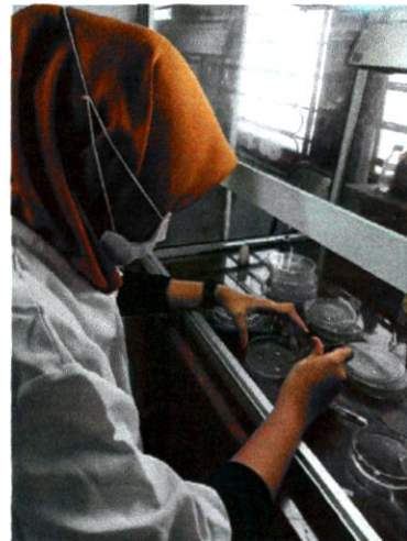
Gambar 4. Proses metode difusi cakram

Tahap selanjutnya, kertas cakram yang telah direndam dalam larutan sampai ekstrak daun ketepeng cina konsentrasi 15% , nistatin 100.000 IU dan kontrol negatif selama 15 menit ditempatkan pada permukaan media agar yang telah diinokulasi jamur uji menggunakan pinset steril. Setelah itu baru masing-masing kertas cakram diletakkan diatas media agar. Media yang telah berisi jamur uji kemudian di inkubasi pada suhu 37°C selama 2x24 jam. Biakan jamur dalam media agar tersebut diamati ada atau tidak zona hambat yang terbentuk.