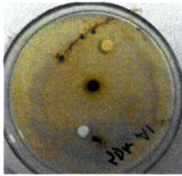
Gambar 5. Cawan Petri yang siap diinkubasi

Media diamati dan diukur perbandingan efektifitas anti jamur ekstrak daun ketepeng cina ( Cassia Alata Linn) dengan konsentrasi 15% dan nistatin konsentrasi 100.000 IU menggunakan jangka sorong.