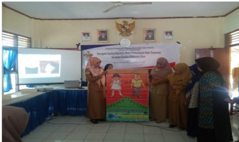
Gambar 5. Demonstrasi tentang cara memasukkan data pengukuran antropometri untuk menentukan status gizi balita