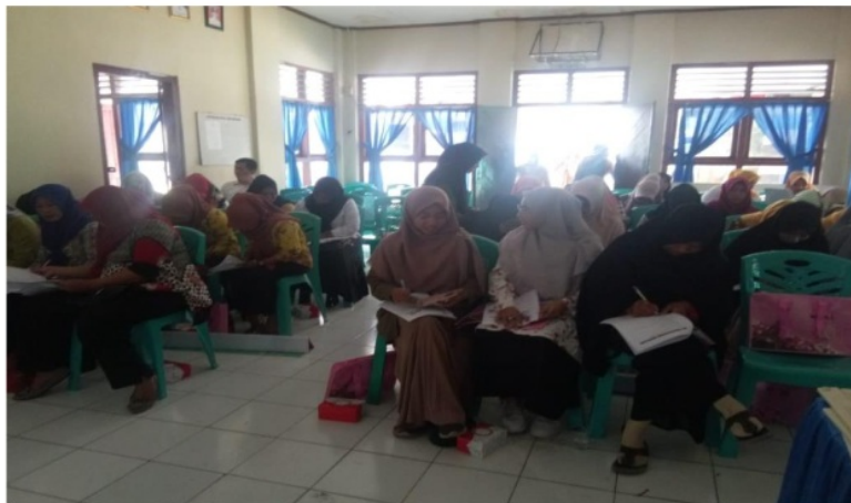
Gambar 2. Pelaksanaan Pre test