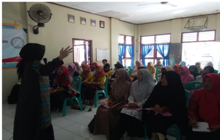
Gambar 3. Pemberian Materi tentang Stunting