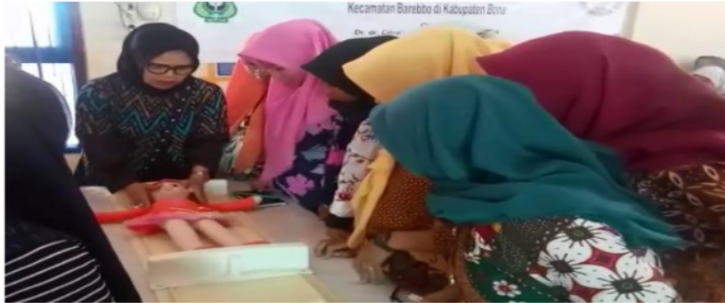
Gambar 4. Pemateri menunjukkan cara melakukan pengukuran panjang badan balita

Setelah dilakukan pemberian materi tentang stunting , peserta kemudian diberikan demonstrasi cara mengukur status gizi pada balita dengan menggunakan alat pengukur panjang badan dan berat badan balita. Demonstrasi dilanjutkan dengan memasukkan hasil pengukuran tersebut kedalam tabel untuk menentukan apakah balita mengalami stunting atau tidak. Hasil pengukuran ini dibedakan antara balita laki-laki dan balita perempuan. Pemateri berusaha melakukan demonstrasi dengan melibatkan peserta, sehingga peserta lebih aktif. Hal tersebut diharapkan dapat meningkatkan pemahaman dan keterampilan peserta dalam melakukan pengukuran antropometri pada balita (Gambar 4 dan 5).